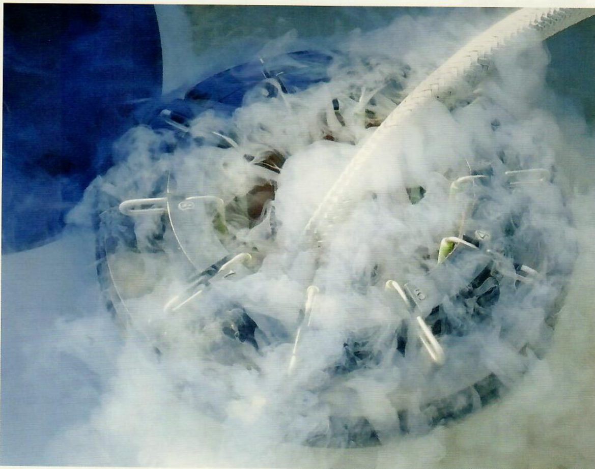
Яйцеклетки забирают под наркозом и мгновенно замораживают в жидком азоте при температуре минус 196 °С.

Яйцеклетки забирают под наркозом (длится процедура около 15 минут) и мгновенно замораживают в жидком азоте при температуре минус 196 °С при помощи криоконсервации. Таким образом процессы старения в клетках останавливаются, они могут храниться практически вечно и использоваться для оплодотворения тогда, когда у женщины наступит для этого благоприятный момент. Длительность хранения зависит не от медицинских показаний, а от законов: в Швейцарии, например, замороженные яйцеклетки можно хранить только 10 лет. Значит, если в наиболее репродуктивном возрасте, в 20 лет, женщина пройдет в Швейцарии процедуру Social Freezing, то самое позднее в 30 лет ей придется либо беременеть с помощью замороженных яйцеклеток, либо их уничтожить. Несмотря на то, что Швейцарская национальная комиссия этики в вопросах медицины человека еще в 2017 году потребовала снять ограничения на криоконсервацию, данный закон пока не изменен. Во многих странах ограничений нет: например, в Чехии яйцеклетки хранятся бессрочно и могут быть использованы женщиной до 49 лет. Закон Швейцарии разрешает женщине использовать ее же клетки, которые она хранит за границей, и теоретически швейцарки могут заморозить свои яйцеклетки в Испании или Чехии, а спустя 20 лет беременеть с их помощью в Швейцарии. Испания и Чехия на данный момент наиболее популярны у медицинских туристов, едущих за границу за подобными репродуктивными технологиями.